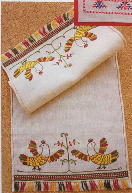
Салфетка, 2007 г., 70x30 см, двусторонняя гладь, мережки