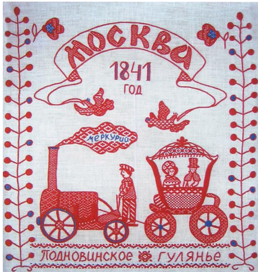
Панно «Подновинское гулянье», 2009 г., вышивка Орловский спис