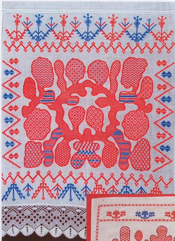
Полотенце «Праздничное» (копия), 2010 г., вышивка Орловский спис, кочлюшечное кружево